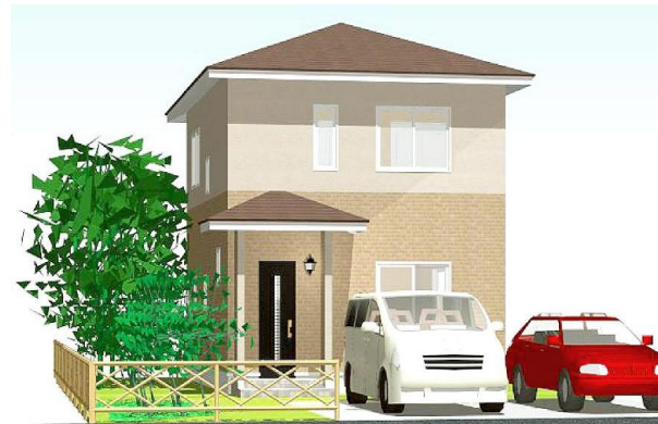
パースはイメージです。(一部オプション含む)

(地盤改良工事 駐車場コンクリート工事費含む) お客様のご希望で仕様を変更される場合は 金額が変わります。 他に登記料等の諸費用が別途必要です。 概算は係員にお尋ねください。